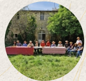
Cloître des Cordeliers