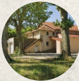
Salle des Fêtes