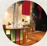
Théâtre du Rond Point