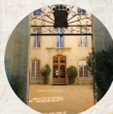
Hôtel de Pellissier