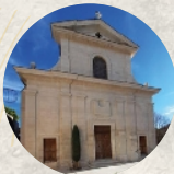
Place de l'Église