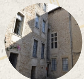
Cour René Jauneau