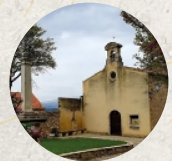
Jardin des Pénitents Blancs