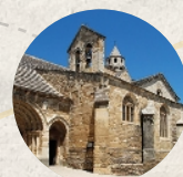
Jardin de l'Église